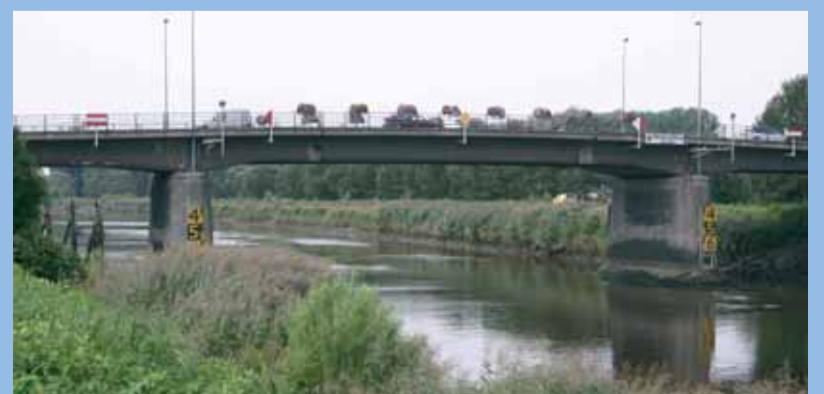
In het openbaar debat van 22/09/2006 stelde Govaert de twee brug nogmaals als prioriteit.

Ook in de gemeenteraad van maart 2000, bij de bespreking van het structuurplan Wetteren, bepleitte Govaert terug de noodzaak van een tweede brug. Tevergeefs. Het huidige gemeentebestuur weigerde zelfs een mogelijke inplanting te voorzien in de toekomst. Nochtans is de kostprijs van een tweede Scheldebrug minder dan de prijs van de nieuwe NOVA. Een tweede Scheldebrug is de start van een economische heropbloei en de basis voor welvaart in Wetteren. Het getuigt dan ook van gebrek aan visie wanneer op het recentste debat terzake (22/09/2006) de CD&V en VLD kake-len dat de brug ofwel niet nodig, of niet realistisch, of onbetaalbaar is, of erger nog dat de brug “er nooit komt” (aldus de huidige burgemeester). Maar als RESPECT in het bestuur zit, staat de bouw van de Scheldebrug terug op de agenda, te beginnen met de aanpassing van het Ruimtelijk Structuur Plan Wetteren.