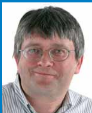
Niko Piscador 6 de plaats RESPECT

En dan de dure vriendjespolitiek van het huidige bewind. Sommige opdrachten worden zonder enige vorm van aanbesteding steeds aan dezelfde vrienden gegund. Personeelsleden die kritiek leveren, worden met sancties bedreigd. Zelfs indien het niet tot rechtszaken komt, kost dit handenvol geld door de verziekte sfeer onder het personeel en daardoor de lagere productiviteit. Als klap op de vuurpijl heeft RESPECT bewezen dat de politieagenten opdracht hebben gekregen om vooral de rode bus van RESPECT in de gaten te houden en zo veel mogelijk te beboeten. Er is zelfs al een akkoord gesloten met een "aangepast" takelbedrijf van buiten Wetteren. Zijn er geen belangrijker taken voor hen weggelegd, zoals het voorkomen van inbraken en drugspreventie? Van een verspilling van overheidsgeld gesproken!