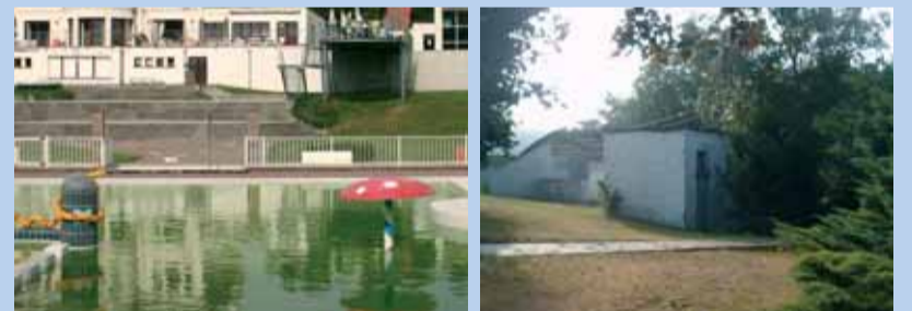
Hoe kan de gemeente De Warande weer interessant maken voor zijn inwoners? U beslist!

Er moet dus een referendum komen over de toekomst van het openluchtzwembad de Warande. "De inwoners moeten zelf kunnen beslissen waar het met hun zwembad naartoe gaat", aldus Govaert.